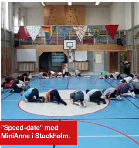
"Speed-date" med MiniAnne i Stockholm.