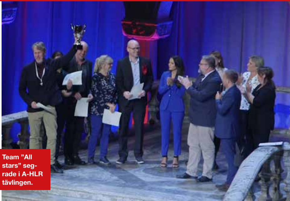
Team "All stars" seggade i A-HLR tävlingen.