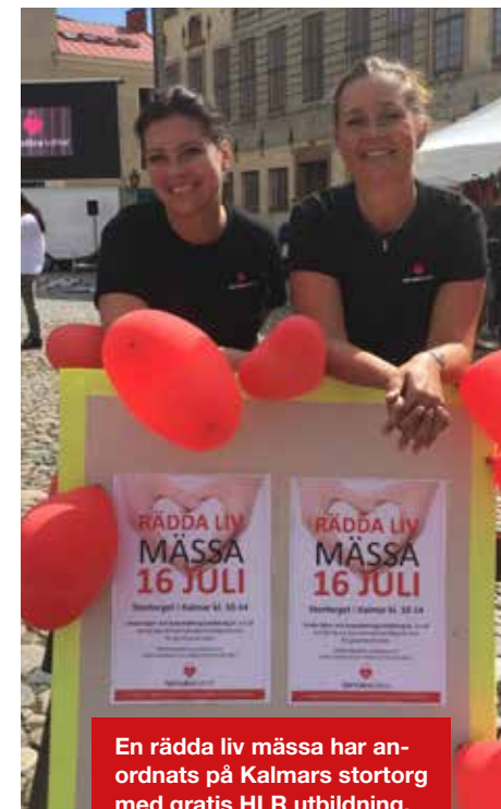
En rädda liv mässa har anordnats på Kalmars stortorg med gratis HLR utbildning.

Efter att ha berättat om sitt projekt på HLR 2019 har många intresserat sig för hur Hjärtsäkra Kalmar har arbetat och liknande projekt är nu i uppstart runt om i landet. Är du också intresserad skicka ett mail till hjartsakrakalmar@gmail.com