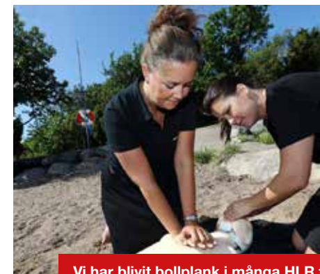
Vi har blivit bollplank i många HLR frågor, här i samband med drunkningstillbud då lokal tidningen gjorde reportage.